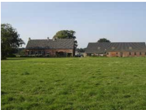
De schuur die we hopelijk in 2009 gaan restaureren

Zoals jullie lezen is er dus weer veel gebeurd op het stille platteland. Blijkbaar geeft het ook veel energie aan ons allemaal.