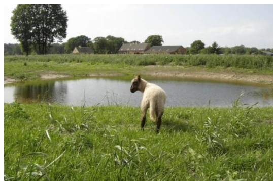
Schaap Gijs op verkenning bij de nieuw gegraven poel

Aan het begin van de zomer, zijn de waterpoelen en de nieuw aangelegde houtsingels op hun mooist. Alle vrienden van De Vijverhoeve worden van harte uitgenodigd om op zaterdag 29 augustus aanstaande vanaf 15.00 uur de nieuw ingerichte natuur te komen bewonderen. Dan zullen er hoogstwaarschijnlijk schapen staan. In het onderhoudscontract voor 2009 hebben we namelijk bedongen, dat er natuurlijk grasbeheer