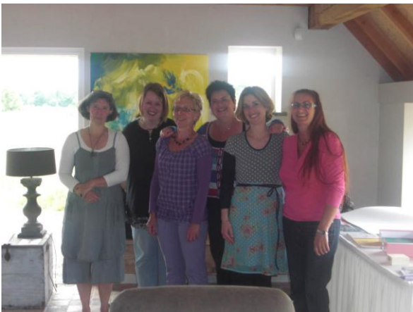
De BV Ont-Moeten van het eerste uur

Op 6 juni kwam de eerste groep B(evlogen) V(rouwen) bij elkaar en het was een groot succes!